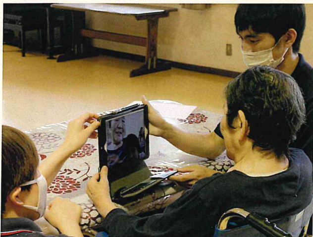
▲iPadの画面 左半分にご本人、右半分にご家族が映っています

新型コロナウイルスの影響で入園者ご家族の面会禁止が続く中、5月25日から園のiPadとご家族のスマホ等のラインアプリを通じてのオンライン面会を、6月29日からは制限を設けての直接面会を開始しました(オンライン面会も継続)。 オンライン面会ではiPadを初めて手にする入園者が殆どでしたが、画面に映るご自分とご家族の顔に驚きつつも、ご家族との会話を喜んでおられました。直接の面会でも、数か月越しに会えた喜びで終始笑顔でした。 今後、国内外の感染状況により防止対策も変化していきますが、少しでもご家族との繋がりを感じていただければ、面会方法について検討を重ねていきます。 *職員が撮影したオンライン面会の様子が、6月1日に玉島テレビで紹介されました。