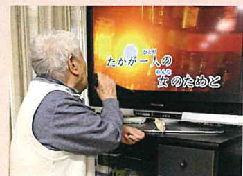
▲感染対策（飛沫防止）のためテレビに向かって熱唱！