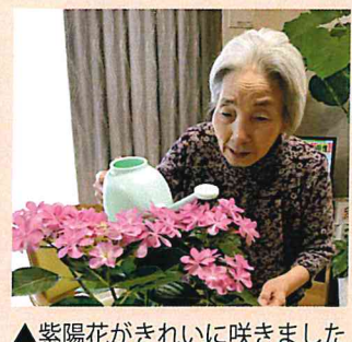
▲紫陽花がきれいに咲きました