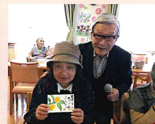
▲絵手紙教室「ピワが色づきました」