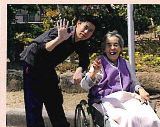
▲外を散歩するのは気持ちがいいですね