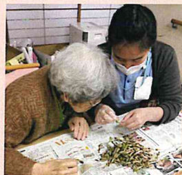
▲つくしの柶を取ってお菓子を作ります