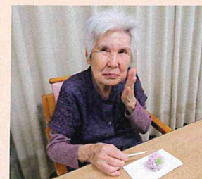
▲茶道教室で和菓子をいただきました