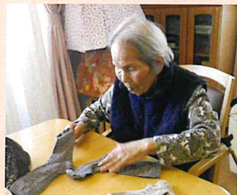
▲洗濯ものをたたむのは任せて！