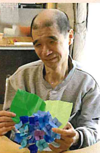
▲折紙で紫陽花を作りました