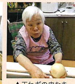
▲玉ねぎの皮むき「きれいにむけたよ！」