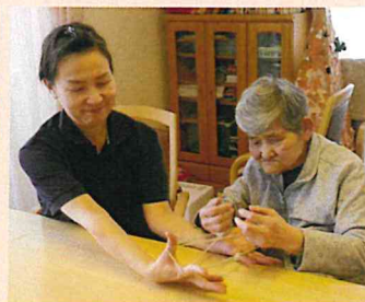
▲懐かしのあやとりに挑戦