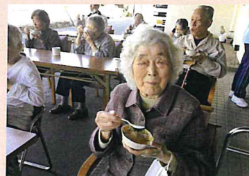
▲青空喫茶で気分転換♪