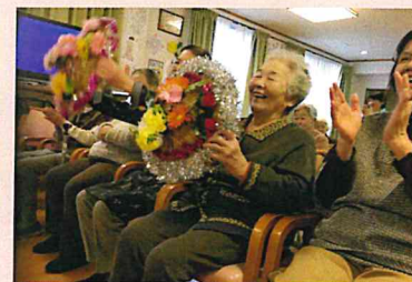
▲リズムに乗って「チョイチョーイ！」