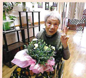
▲母の日にカーネーションが届きました