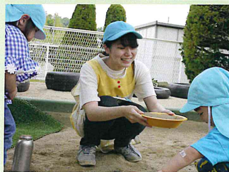
▲八幡保育園に配属後、2歳児の保育を担当している秀先生(中央)