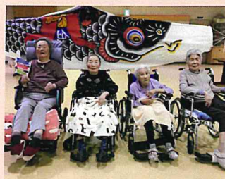
▲大きなこいのぼりの前で記念撮影