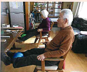
▲ボールを使って筋力アップ！