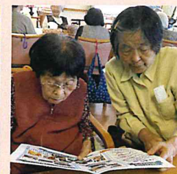
▲「私たちが写ってるかしら？」