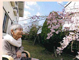
▲今年も庭の桜が満開に咲きました