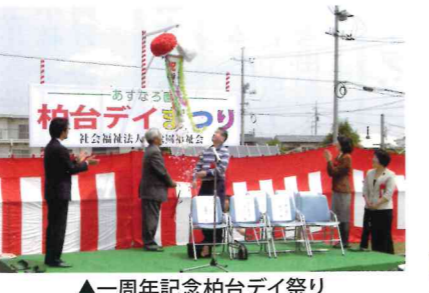
▲一周年記念柏台デイ祭り

演芸部門では、開設一周年のおめでたい舞台なので、みつば会様が、「三番叟」を演じていただき、地元柏台町内会、おかめ会様による舞踊、カラオケ同好会様による、カラオケ大会など盛大におこなわれた。 屋敷部門では、こちらも柏台栄養改善グループの御協力により、焼きそば、うどん、フランクフルトなど販売され、完売した。 展示部門では、デイ・サービス利用者作品展、玉島南高齢者支援センターによるパネル展示などがあり、デイ・サービス利用者、地元町内の人々で、にぎわいをみせた。 開設一周年を無事にむかえられ、また、第一回柏台デイ祭りが、盛大に行われました。これも、準備段階より、地元柏台町内会の御協力があればこそと、スタッフ一同感謝いたしております。 これからも、スタッフが丸となり、地元町内会のご尽力も頂きながら柏台デイ・サービスセンターが広く皆様にあいされるように、頑張っております。