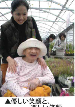
▲優しい笑顔と、楽しい笑顔