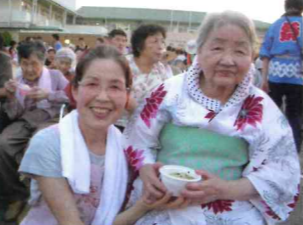
▲焼きそばは美味しかったよ