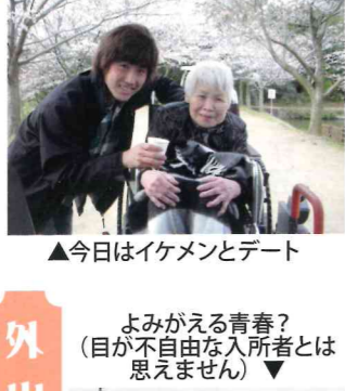
▲今日はイケメンとデート