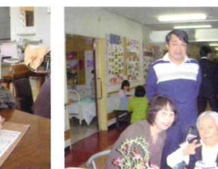
▲家族面会が何よりうれしい