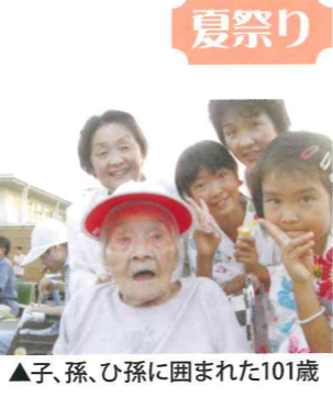
▲子、孫、ひ孫に囲まれた101歳