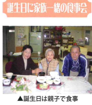
▲誕生日は親子で食事