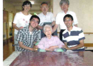
▲子、孫に囲まれて嬉しそう