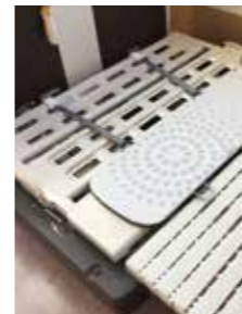
▲マットレスの下に設置される眠りSCAN本体