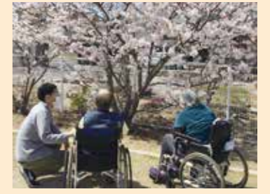
▲ あすなろ園内の芝生でお花見