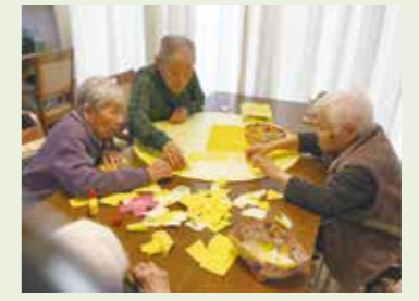
▲ 利用者同士相談して壁画を作成中