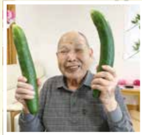
▲ 大きなきゅうりが出来たで