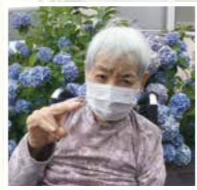
▲ 園庭の紫陽花と一緒に