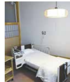
▲全床新しいベッドに入れ替え