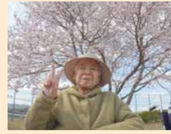
▲ 満開の桜の下で自然と笑顔に