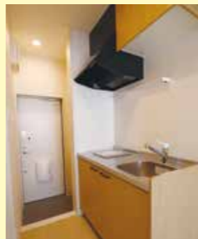
▲自炊が出来るミニキッチン