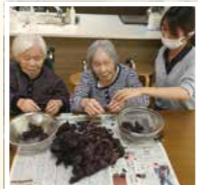
▲ 家庭菜園のしそで、しそジュース作ります。