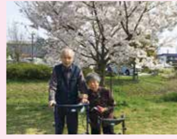
▲ 夫婦仲良く ハイポーズ!