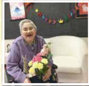
▲ お化粧をして誕生日の記念写真!!