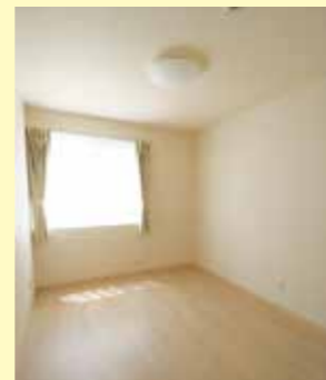
▲全室南向きの明るい室内