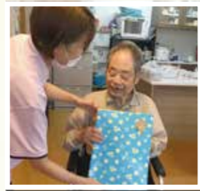
▲ お誕生日おめでとうございます