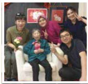
▲ 母の日に職員と一緒にハイチーズ。