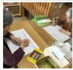
▲ 手本を見ながら字の練習