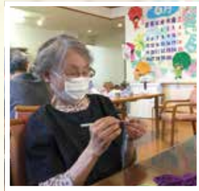
▲ くさり編みでエコたわし作り!