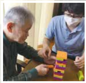
▲ ジェンガは得意です