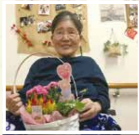
▲ 母の日にキレイなお花が届きました