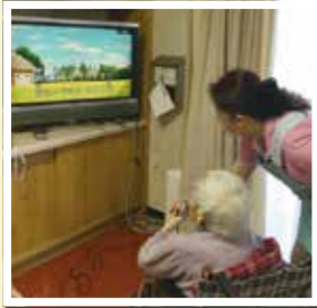
▲ テレビでカラオケ、いい歌声〜♪