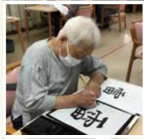
▲ 一筆に気持ちを込めて