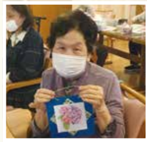
▲ ぬりえ教室 見て!見て! 上手にかけましたよ