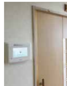
▲各部屋に設置された液晶パネル

日頃の小さな気づきから、眠りスキャンの記録を確認することで体調や睡眠の変化が確認できます。また、平常時と比較したり、夜間の測定結果も確認できることから、より詳しく体調管理ができるようになります。