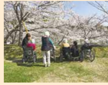
▲ 来年も皆で花見に来たいねえ