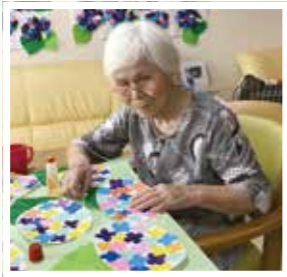
▲ バランスよく貼り付け