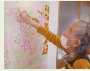
▲ そろそろ満開ですね。