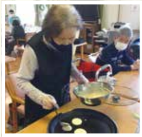
▲ クッキング どちら焼き作り