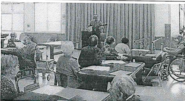
▲楽しみながら習う民謡教室

趣味活動で最も人気が高いのが、民謡教室。毎週一回、食堂で行っています。毎回四十名程が出席。これまでに、炭坑節、草津節など二十数曲をマスターしています。