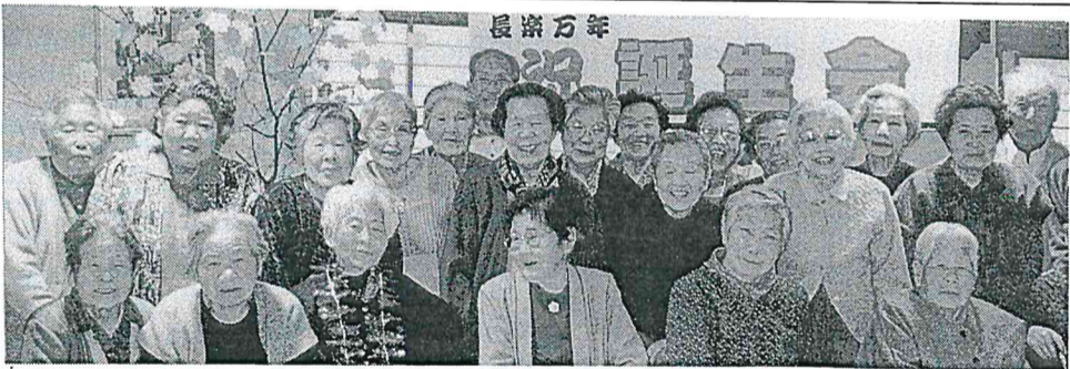
▲ある日のデイ・サービス・笑顔がいっぱい

毎週一回のデイ・サービスが待ち遠しくて、その日は朝からうきうきしています。食事やおしゃべり、いろいろな習いごとや物づくりが楽しめます。また、職員さんがやさしくて親切。バスの運転手さんに至るまで、乗り降りの時でもやさしく声をかけてくれます。ゲームで体を動かしたり、友達と話したりしていると、一日があっという間に過ぎてしまいます。近所の方にも誘ってあげると「早よう来りゃ」