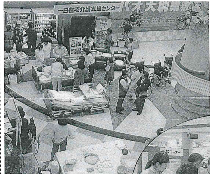
▲三支援センター合同で開催された「一日在宅介護支援センター」会場。関心を集めた健康チェックコーナー、介護用品コーナー

と重なり、特設会場付近は大勢の買物客でにぎわっていた。特に健康チェックコーナーでは、一時行列がでるほど。 会場には、「一日在宅介護支援センター」の看板を掲げ、相談コーナー、介護機器展示コーナー、健康チェックコーナー、介護用品手づくりコーナーが設けられた。そして、各支援センターの職員や母体施設の職員、県、市、社協等関係者が、相談や実演、説明にあたった。 介護機器展示コーナーでは、ワンハンド式の車椅子が人々の関心を集め、試乗して店内を回る姿も見られた。 相談コーナーでは、「将来の生活に不安を感じる」、「特養ホームへ入所するにはどれくらい費用がかかるのか」、「夫が最近ボケ症状が出た」等々の相談があいついだ。